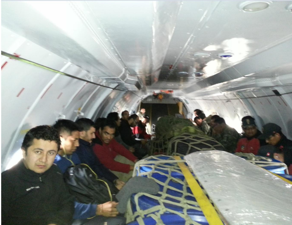
Cuerpo General de Bomberos Voluntarios del Perú